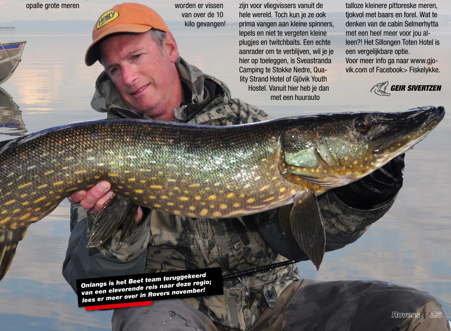
Onlangs is het Beet team teruggekeerd van een elevelende reis naar deze regio; lees er meer over in Rovers november!