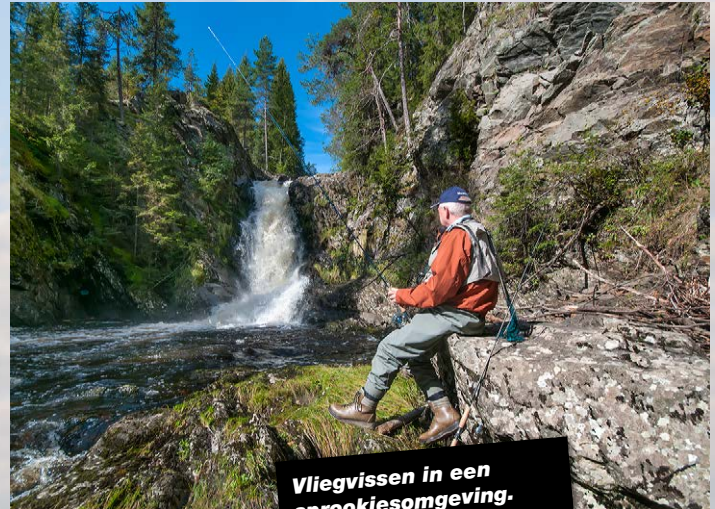
Vliegvisser in een sprookjesomgeving.

zijn onvergetelijk. Heb je zelf de beschikking over een makkelijk demonteerbare fishfinder, neem hem voor de zekerheid mee. Niet alle huurboten zijn uitgerust met de modernste elektronica. Behalve snoek maak je op alle grote meren