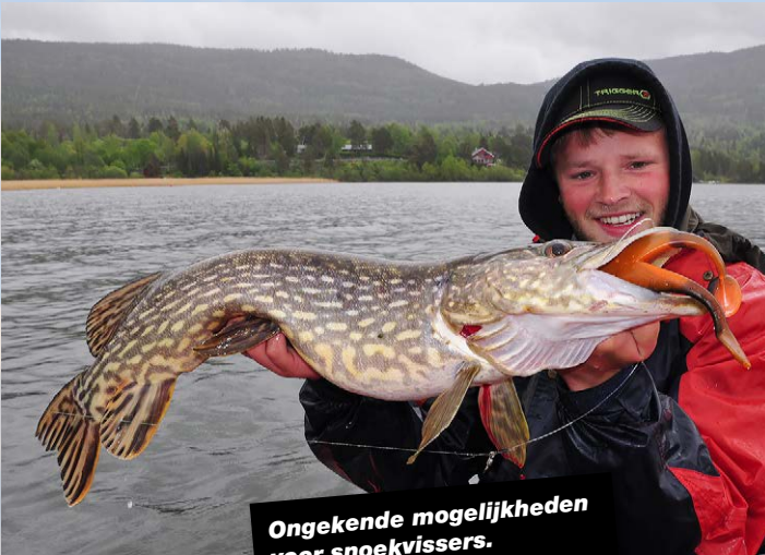
Ongekende mogelijkheden voor snoekvissers.